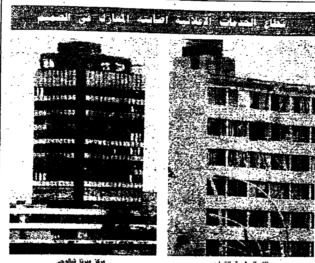
مركز ميرنا شالوشي - سلق البوشية التجريفة. كان بين القطاعات الكبيرة التي تركت الخيرة الثريا عليها. حرقا وتدميرا وحطبا، فنهوت المراكز وتحطمت المكاتب وتشرشت المكاتب وتشتت البشر.

ومن هنا ومن سلحة الشهداء بالذات، تحلن مواطنا ونطالب في ذكرى معروف سعد بسلامكم، اغنياء مدينة صيدا للمساهمة في تطوير مدينتهم وليس الاكثار فقط على رايح الحرييري كما تقول لكم اننا نعرف تماما ان بعض القلماء يحاولون خلق اوضاع اصية غير مستقرة في صيدا وقد اصبحوا الآن معروفين منا وسنعمل معهم بوقوفنا المعروفين من ذكرى معروف سعد.